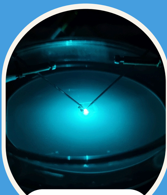
materiały półprzewodnikowe i optoelektronika