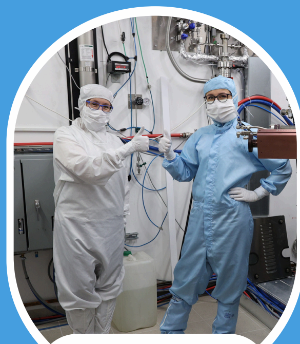
nowoczesne laboratorium cleanroom